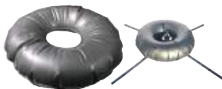
Lest à eau