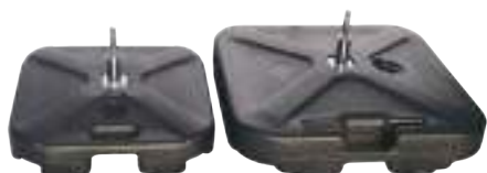
Pied parasol à remplir