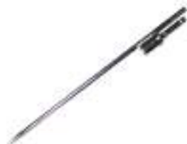
Piquet à frapper