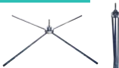
Croix légère chromée