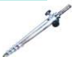
Vrille sable et neige